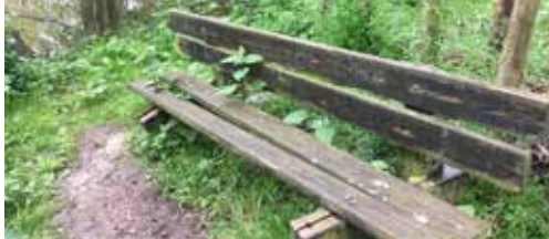
Red natuurgebied De Zijp p.2