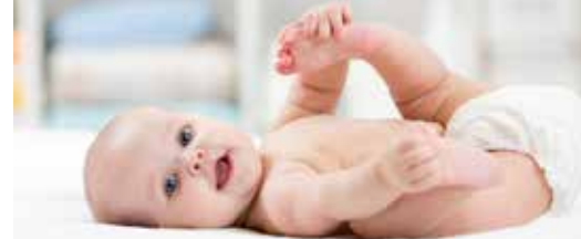
N-VA vraagt luierbank in Nieuwerkerken p.3