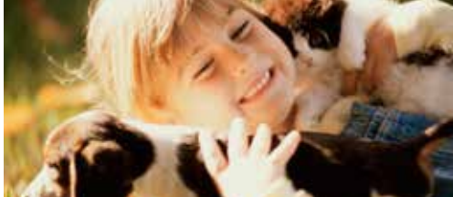
N-VA vraagt actieplan dierenwelzijn p.2