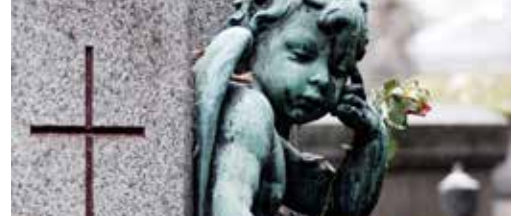
Word jij een engelbewaarder voor graven? p.3