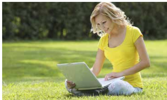
▲ De N-VA wil dat de gemeente de digitale dienstverlening naar de burger verbetert.